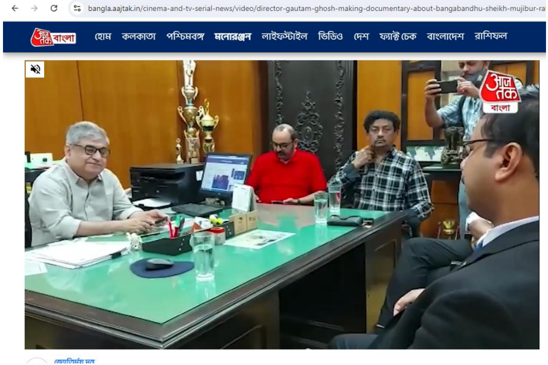
Principal of Maulana Azad College interacting with Goutam Ghose and officials of the Bangladesh Deputy High Commission, Kolkata, during the film director's visit